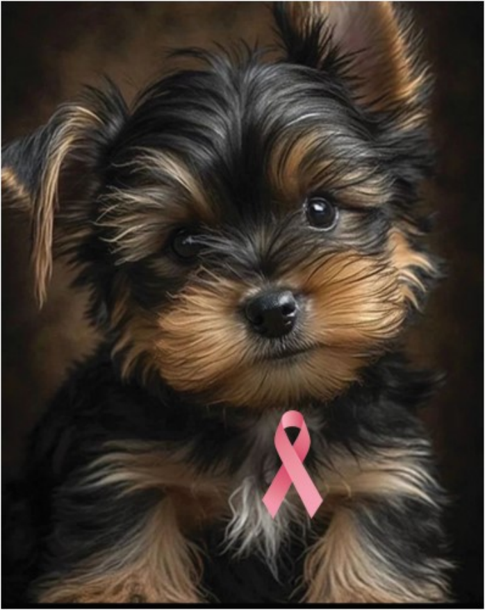
Our Little Lizzy